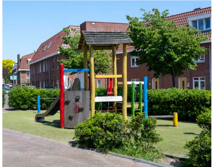
Huidig speeltoestel op Fabriplein