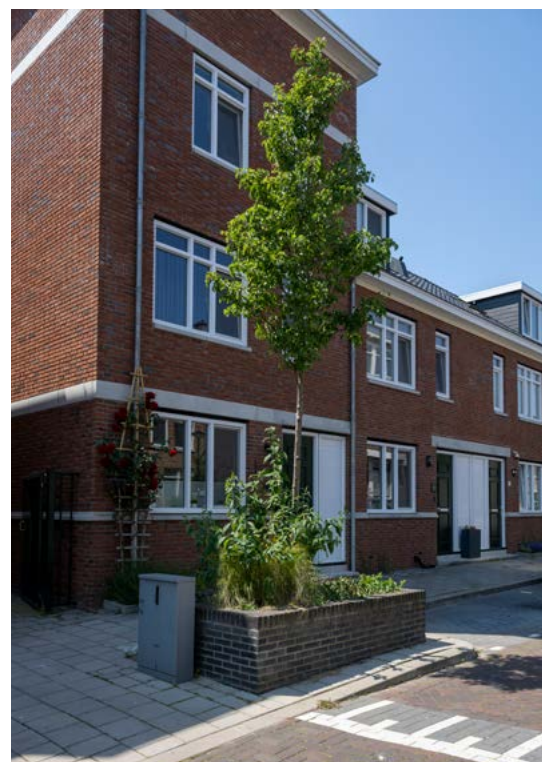
Thomas à Kempisstraat

De gemeente Schiedam vervangt de riolering, bestrating en verlichting. Ook wordt het groen en een aantal speelplekken opnieuw ingericht.