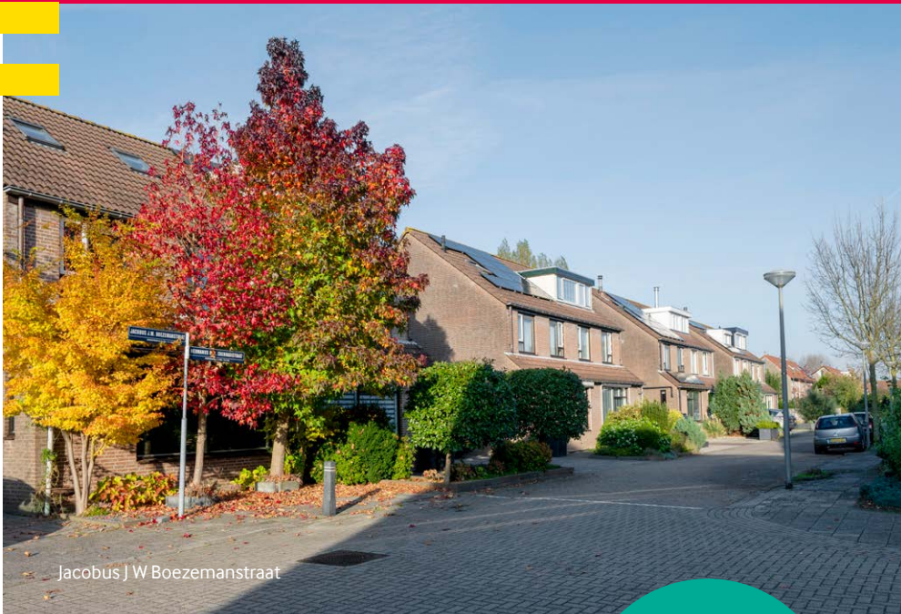
Jacobus J W Boezemanstraat