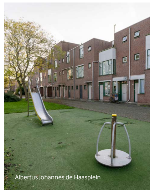
Albertus Johannes de Haasplein