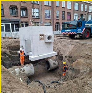
Putten Sint Liduinastraat