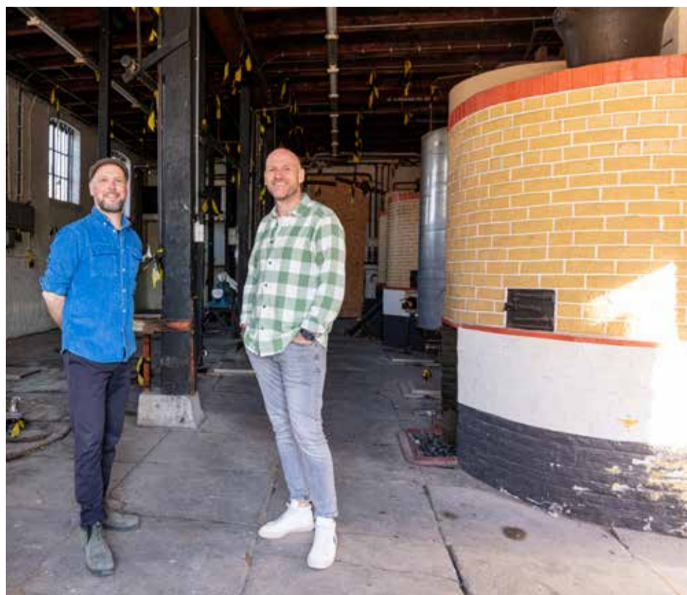
De voormalige ketels blijven behouden en staan straks in restaurant ROOK.