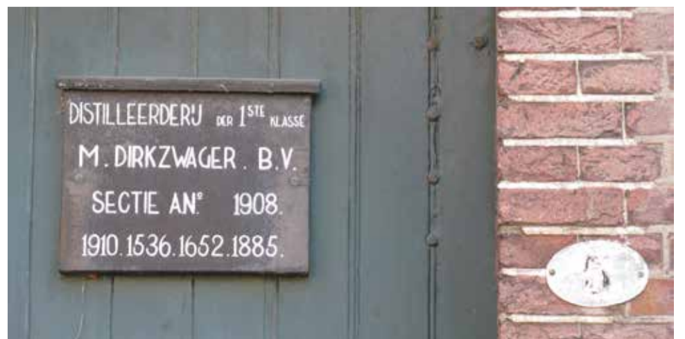
Het bordje van distilleerderij Dirkwager op de deur van Groenweegje 5