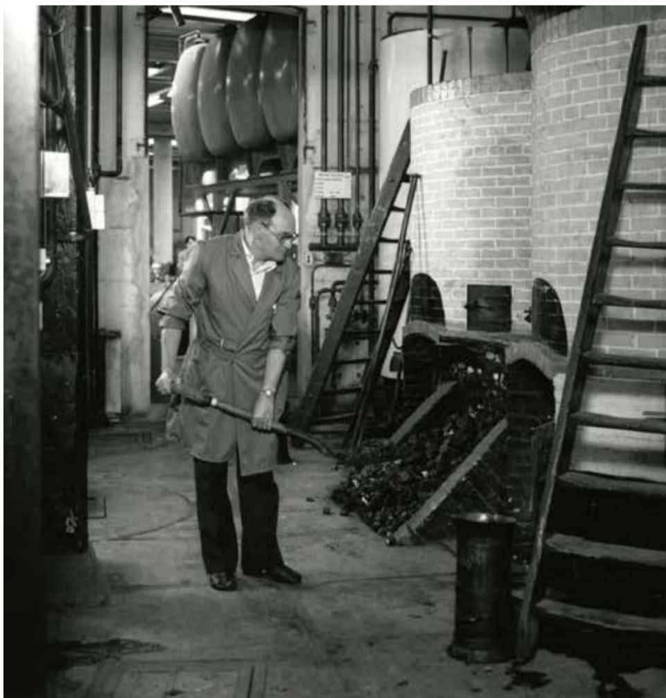
Man stookt het vuur onder een distilleerketel bij de distilleerderij Dirkwager, Groenweegje 4