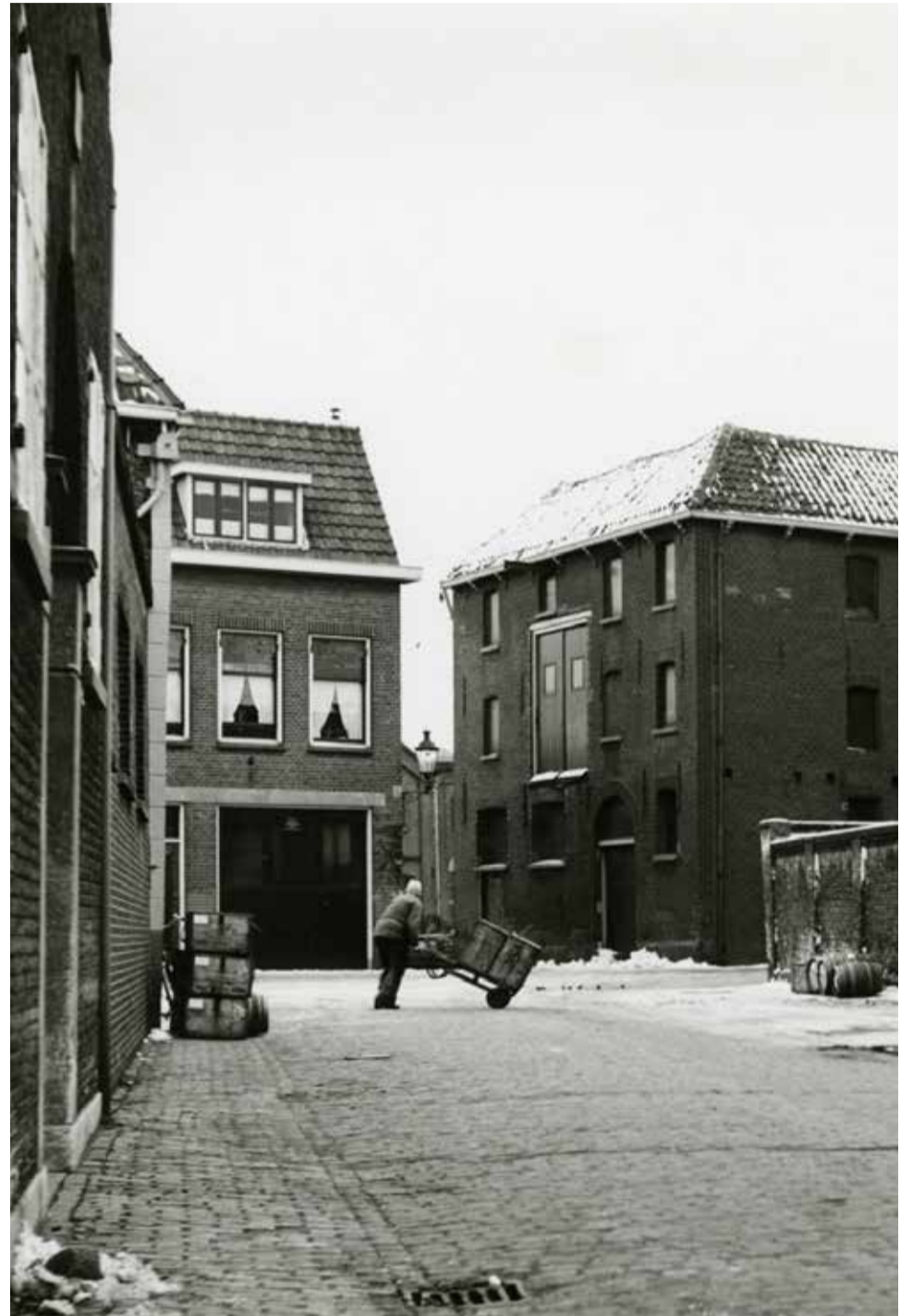
Het Groenweegje in de jaren 50 de gebouwen links en rechts zijn in gebruik bij distilleerderij Dirkwager

Het was een drukke bedoening op het Dirkwagerterrein. Dit was ook de tijd dat Schiedam de naam 'Zwart Nazareth' kreeg. Doordat in de branderijen en glasblazerijen op steenkool werd gestookt, kwam er een dikke laag rook boven de stad. Daardoor kwam er roet op de daken en muren van de huizen.