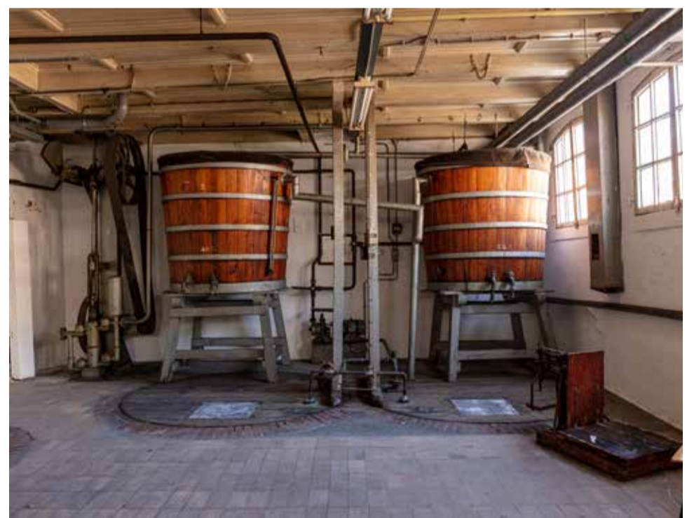
De houten vaten blijven behouden en vormen straks de entourage van koffiebar Stoom

Het ziet ernaar uit dat deze zomer na de bouwvak gestart wordt met de bouw. De bouw duurt ruim een jaar en het team heeft 3 à 4 maanden nodig voor de inrichting. Dat betekent dat het Distillers Hotel ongeveer eind 2025 de deuren zou kunnen openen.