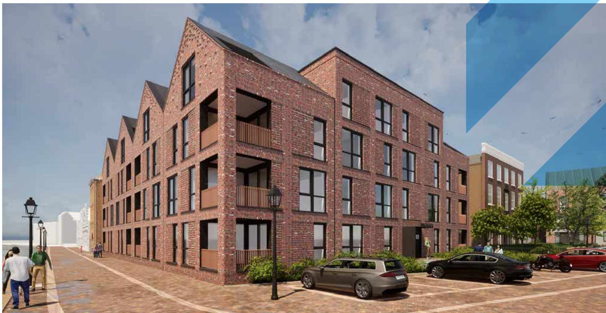
*Conceptbeeld ter illustratie, hier kunnen geen rechten aan worden ontleend.

Wil je op de hoogte blijven? Schrijf je dan in voor de nieuwsbrief op DirkwagerSchiedam.nl/appartementen