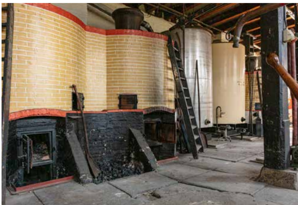
De voormalige ketels blijven behouden en staan straks in restaurant ROOK