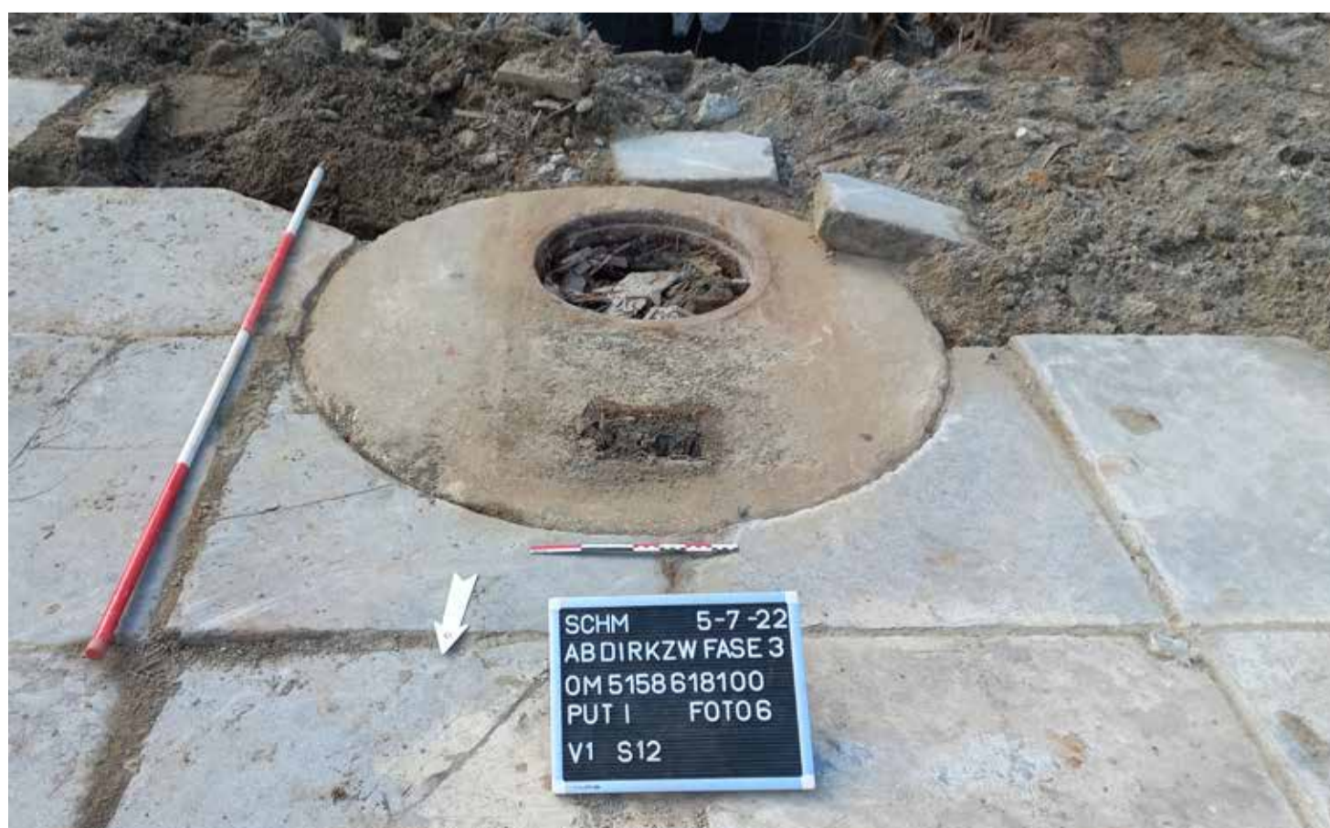
Grondvat in situ