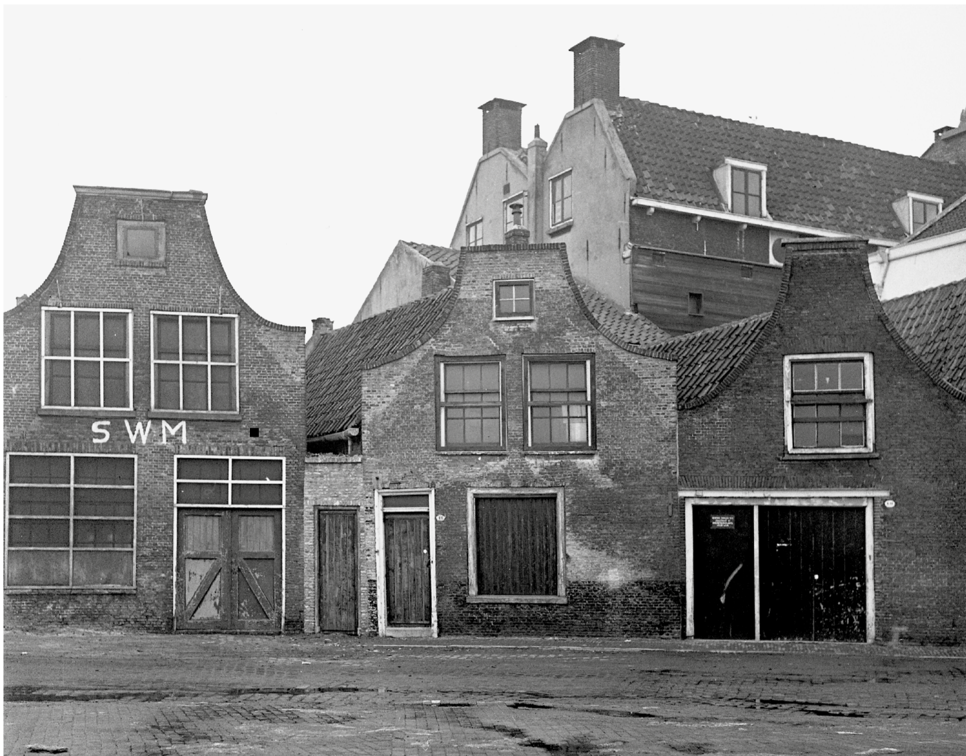
Voorgevels van de voormalige brandershuisjes aan de Zijlstraat 8, 10 en 12