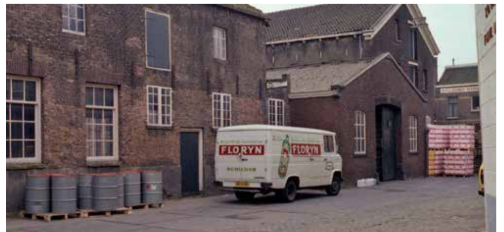
Een vrachtwagen van Floryn jenever van distilleerderij Dirkwager op het Groenweegje