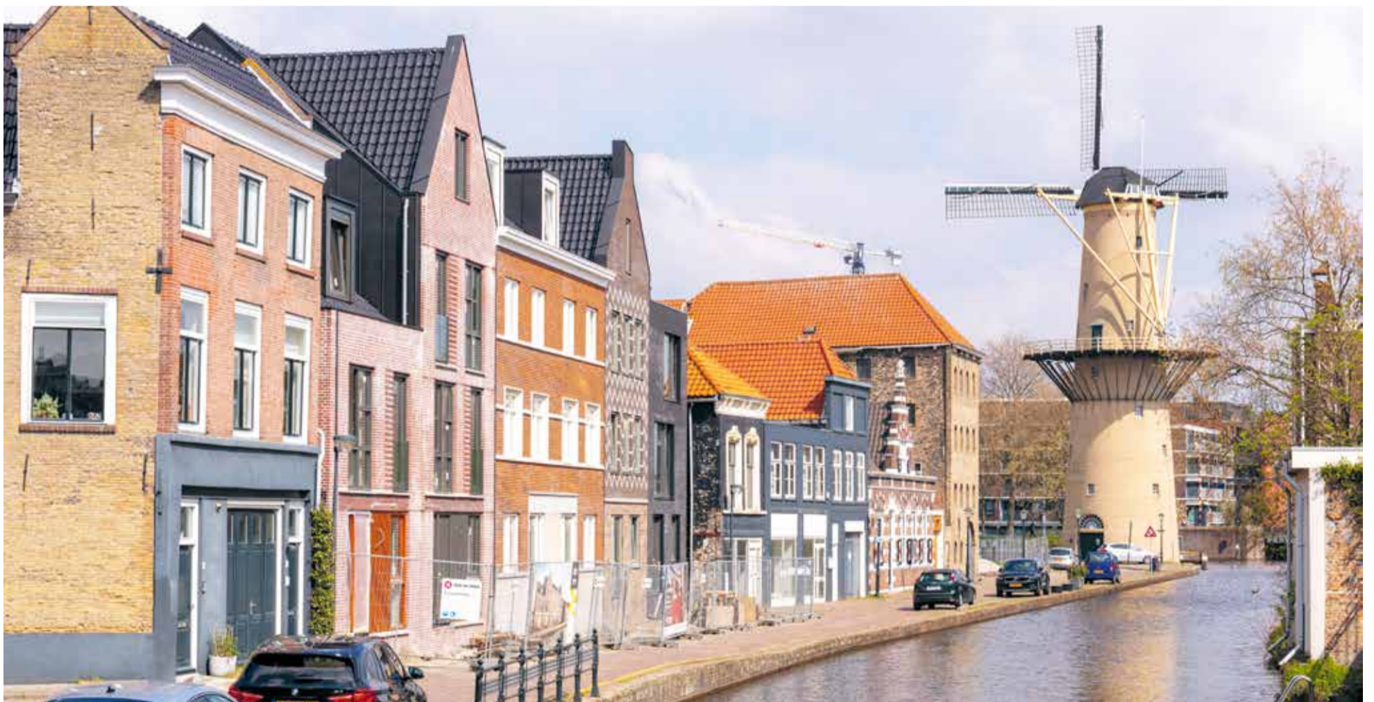
Fase 1 herenhuisen langs de Schie