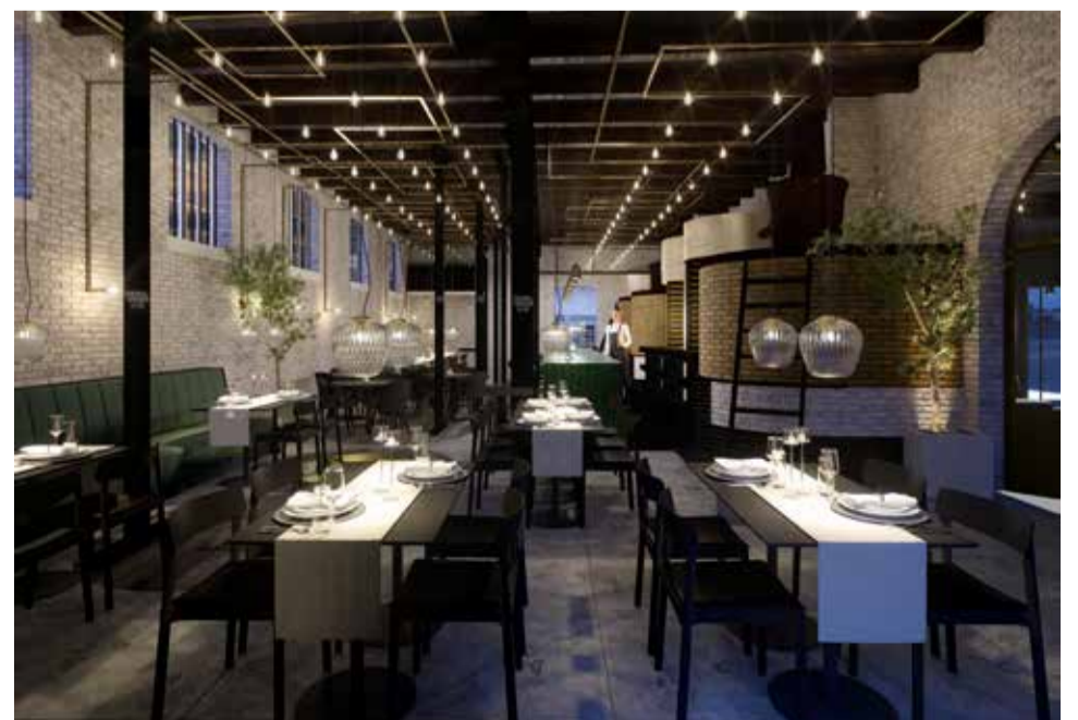
Restaurant-Bar Rook tussen de voormalige ketels, ontwerp ARD AtelierRuimDenkers