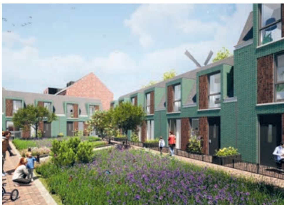
Hofwoningen impressie - voorlopig ontwerp