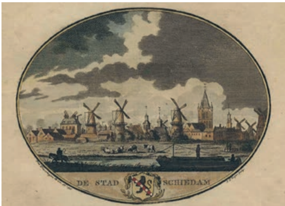
Tekening van een trekschuit in Schiedam

Vandaag de dag wordt er weer werk gemaakt van de trekvaarten. "Ik ben sinds een jaar of 10 betrokken bij een provinciaal project dat de trekvaart als verbindende lijn tussen alle Hollandse steden mogelijk wil maken. Het zou mooi zijn als we het water weer optimaal kunnen beleven als we er langslopen, aan wonen of op een bankje zitten en kijken hoe de sloepjes en boten voorbijvaren. Bij de ontwikkeling van Dirkwager is dat goed gedaan. Hier komen woningen langs de kades en overal zijn straks doorkijkjes en paadjes waardoor je verleid wordt om langs het water te wandelen en te zitten.