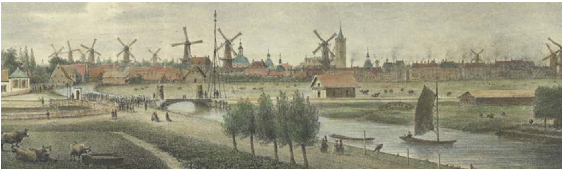
Tekening van Schiedam met op de voorgrond 2 spoelingschuiten