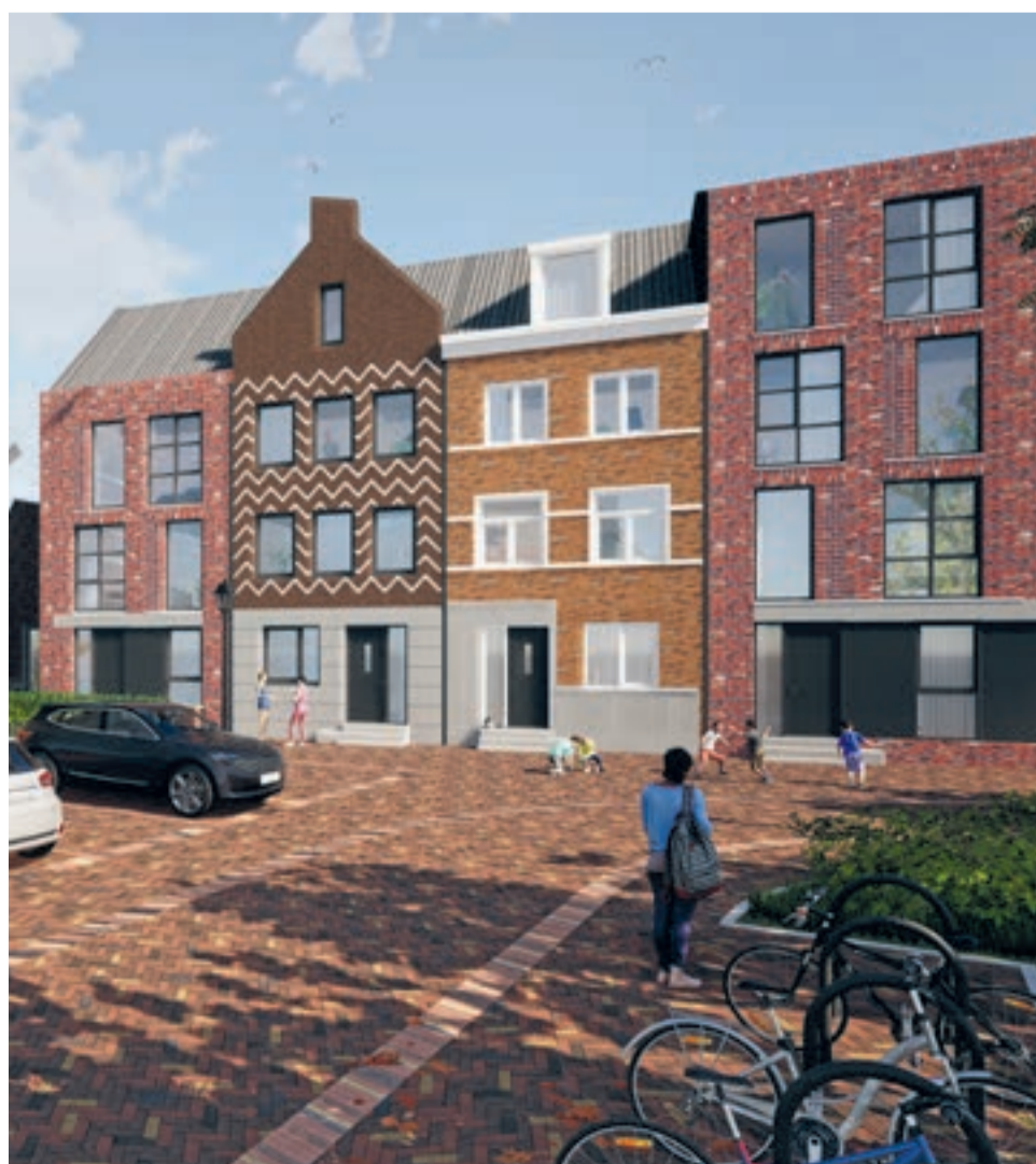
Fase 2A aan het Doelenplein

Fase 2 is opgedeeld in 2A en 2B. Er komen in totaal 51 woningen. De 27 woningen van fase 2A gaan na de zomervakantie in verkoop. Deze woningen komen tussen 't Groenweegje, de nieuwbouw van fase 1, Noordvest en het nieuwe Sint-Jorisplein. Er is veel te kiezen. Er komen woningen in allerlei groottes, variërend van 88 m 2 tot 203 m 2 . Fase 2B wordt een 4-laags appartementencomplex met 24 appartementen aan het Doeleplein. De grootte van de appartementen varieert van 90 m 2 tot zo'n 145 m 2 . De verkoop van fase 2B start waarschijnlijk eind 2023, begin 2024.