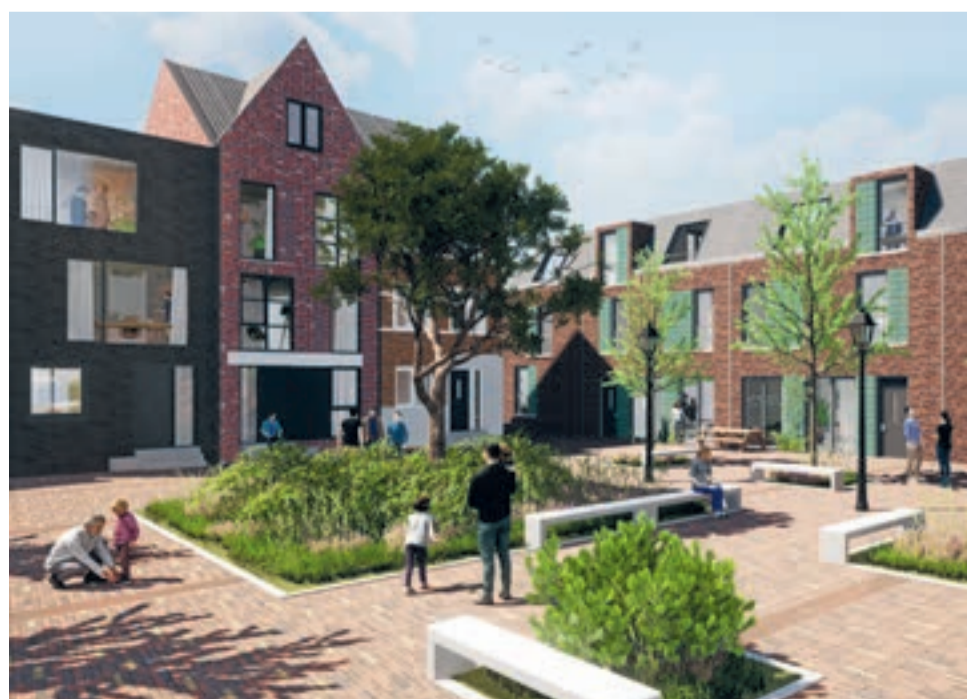
Pleinwoningen impressie - voorlopig ontwerp