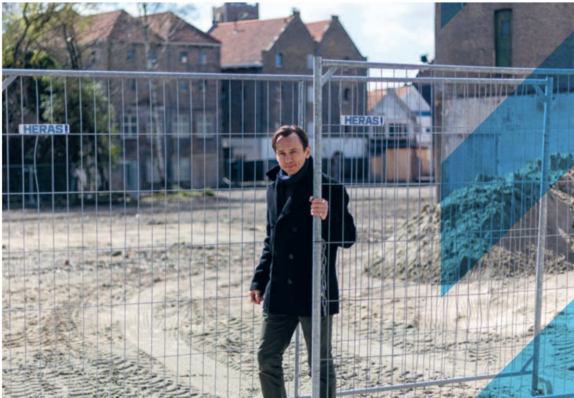
Ralph van de Donk - Stats Architecten

DIRKZWAGER WORDT EEN GEZELLIGE, LEVENDIGE STADSKUUR MET ONGEVEER 130 WONINGEN, HORECA EN HET DISTILLERS HOTEL. DE BUURT LIGT OP EEN SCHIEREILAND IN DE BINNENSTAD VAN SCHIEDAM TUSSEN DE NOORDVEST, 'T GROENWEEGJE EN DE PALMBOOMSTRAAT. RONDOM IS WATER EN DE OUDE MOLENS HEB JE ALTIJD IN HET ZICHT.