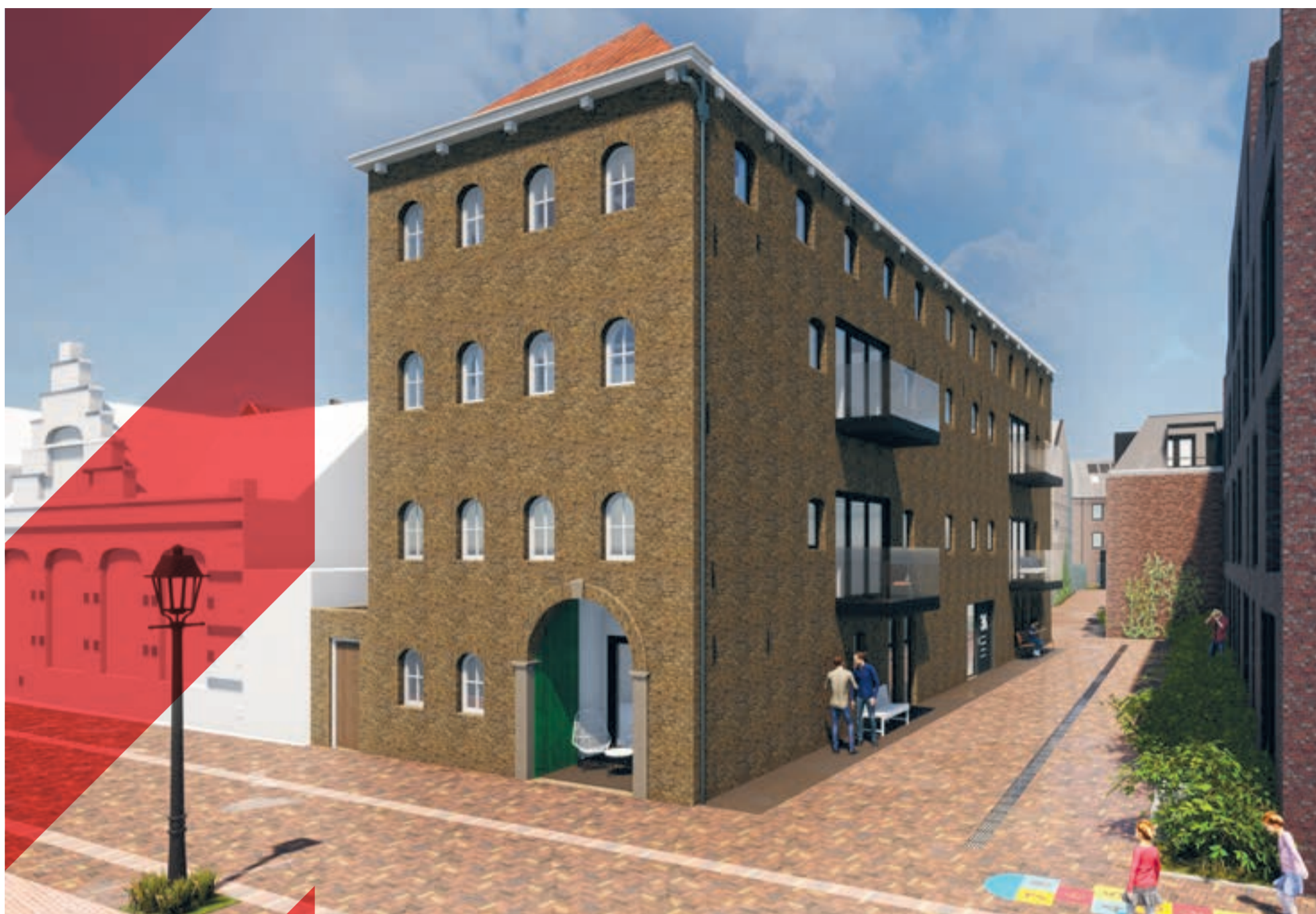
Impressie Schie 36 na transformatie