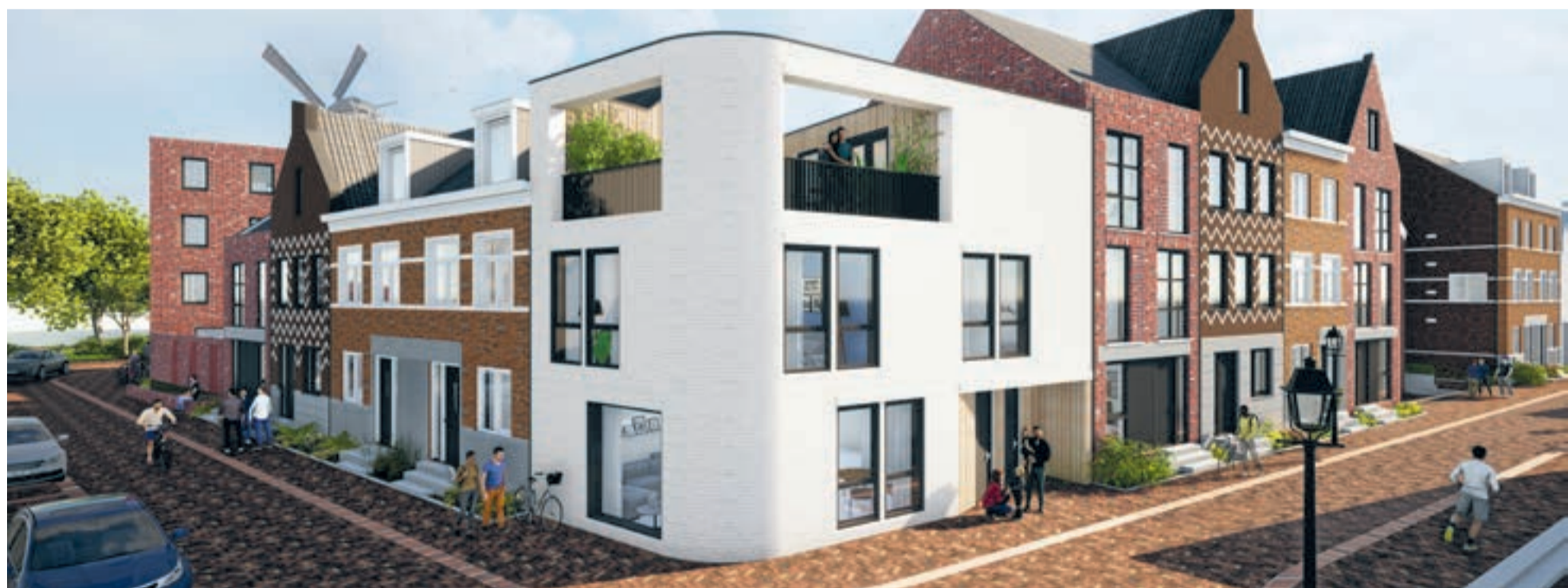
Woningtype Floor impressie - voorlopig ontwerp