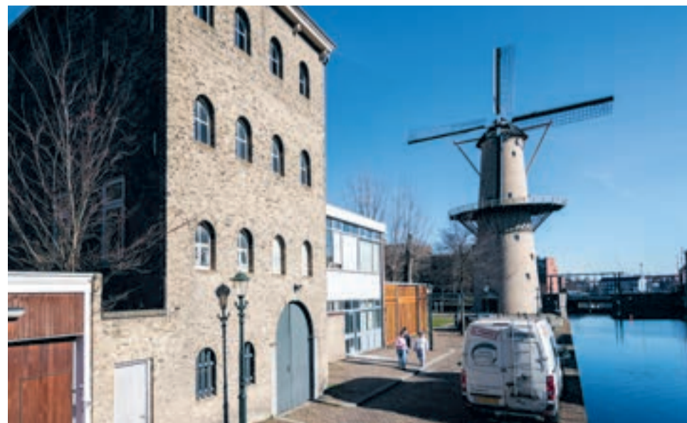
Schie 36 met molen De Kameel