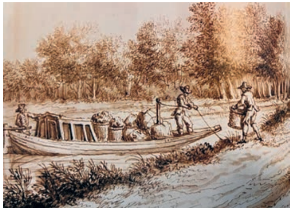
Tekening van een trekschuit