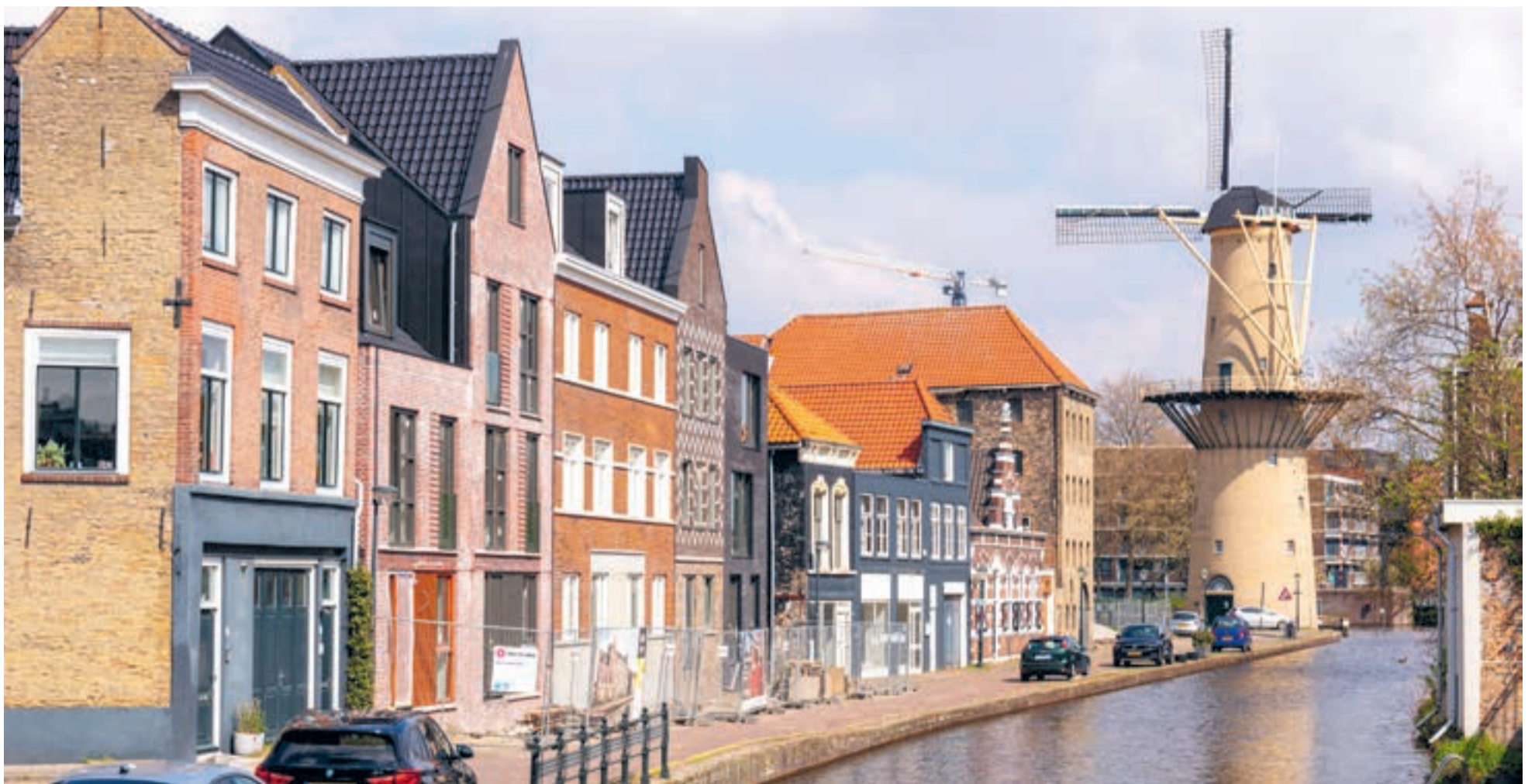
Fase 1 herenhuizen langs de Schie

WETHOUDER SCHIEDAM, BOUWEN, HAVEN EN SPORT @Antoinettelaan