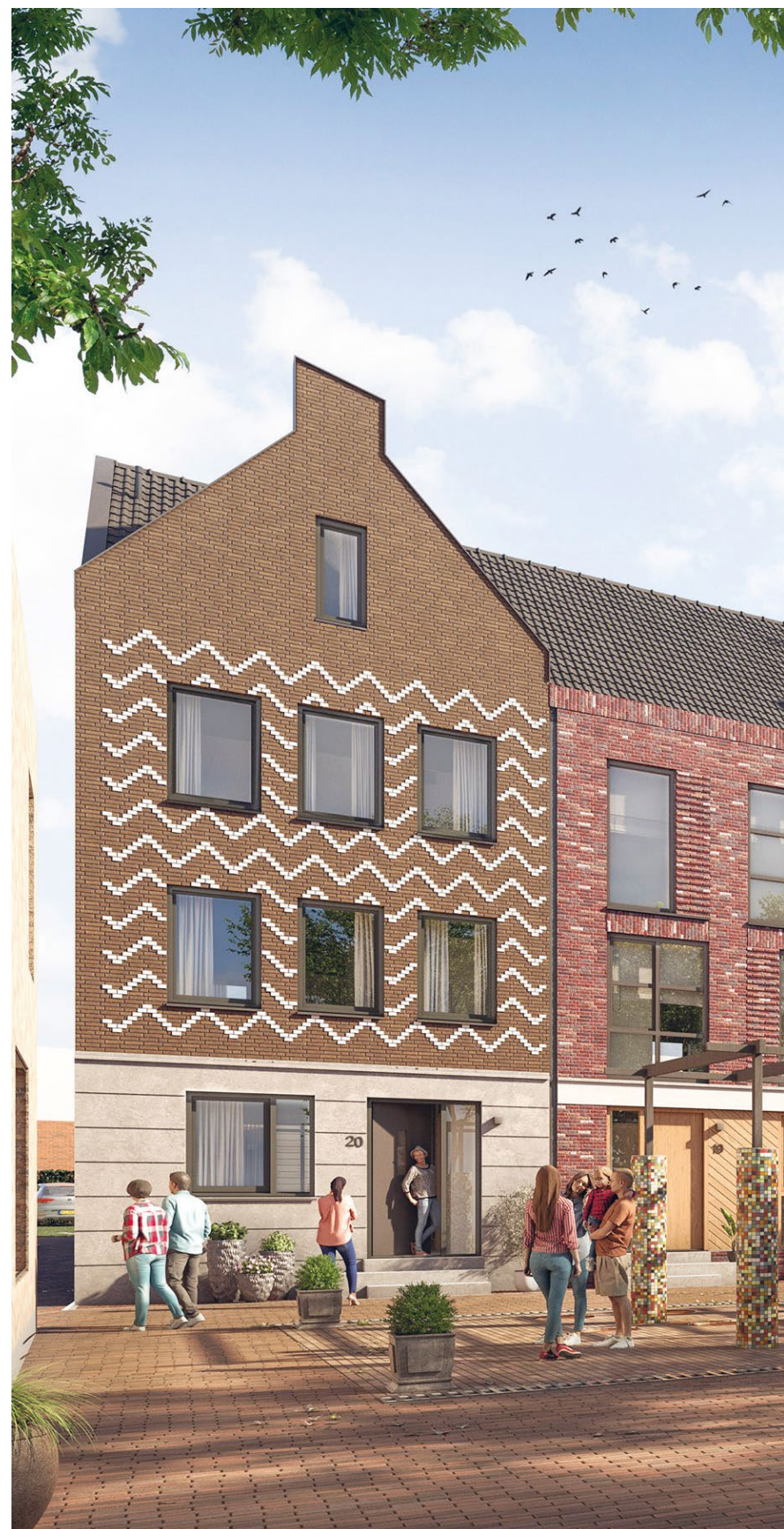
Artist impression toekomstige inrichting Sint Jorisplein in het hart van de nieuwe Dirkzwager-buurt