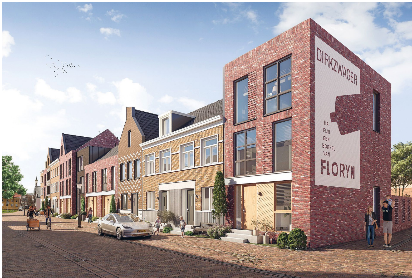
Artist impression van de verschillende typen woningen die worden gebouwd vanaf maart 2022

gebouwd, waar rekening moet worden gehouden met tal van zaken. Kim: "Dit is niet te vergelijken met een nieuwbouwwontwikkeling in een weiland. We hebben dus veel met elkaar gepraat om tot overeenstemming te komen, maar we zijn er altijd uitgekomen."