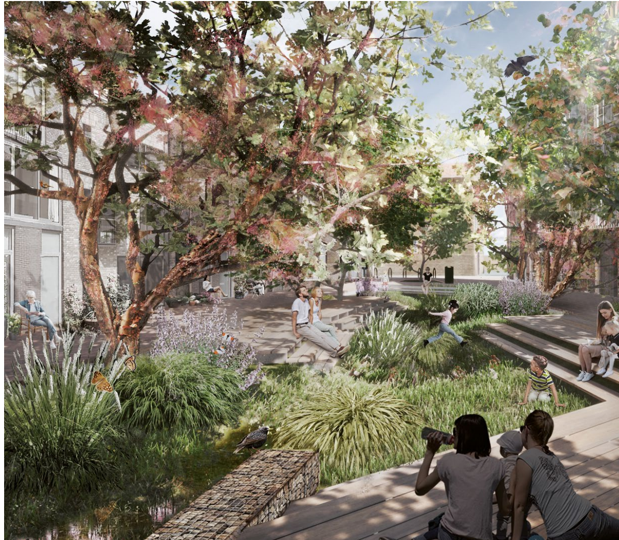
Artist impression van groene, duurzame inrichting buitenruimte in fase 3